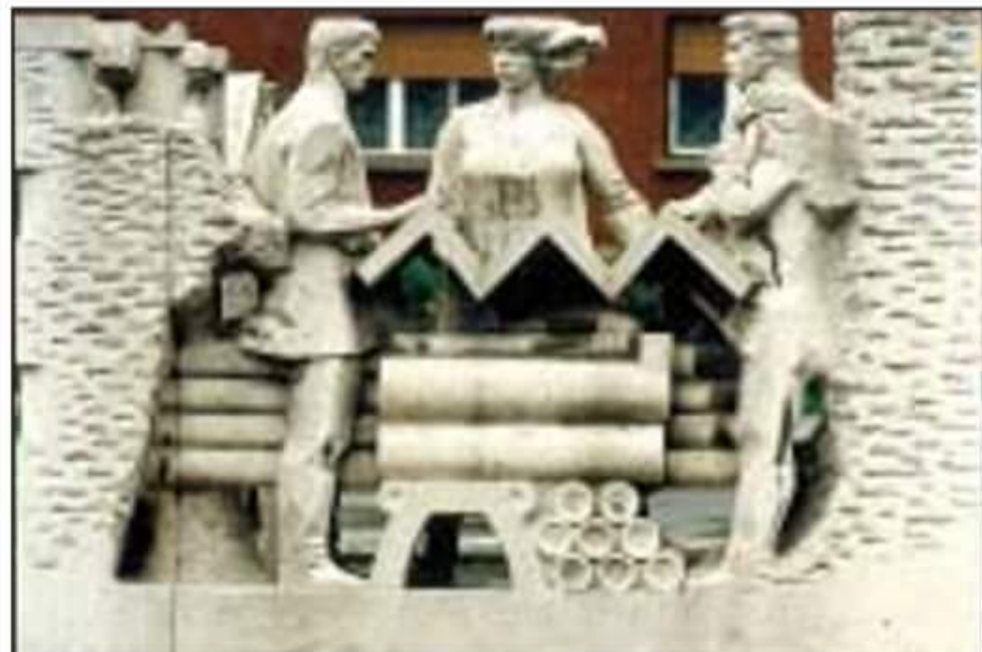
Memento: Tapolca bányászváros volt

Szent Borbáláról , a bányászok védőszentjéről mintázott csodálatos lányalak a Tamási Áron Művelődési Központ előtt áll. Kezében a természet erőinek kiszolgáltatott bányász örök jelképét helyettesítő mécses, és a győzelmet hirdető pálmágot helyezte el a művész.