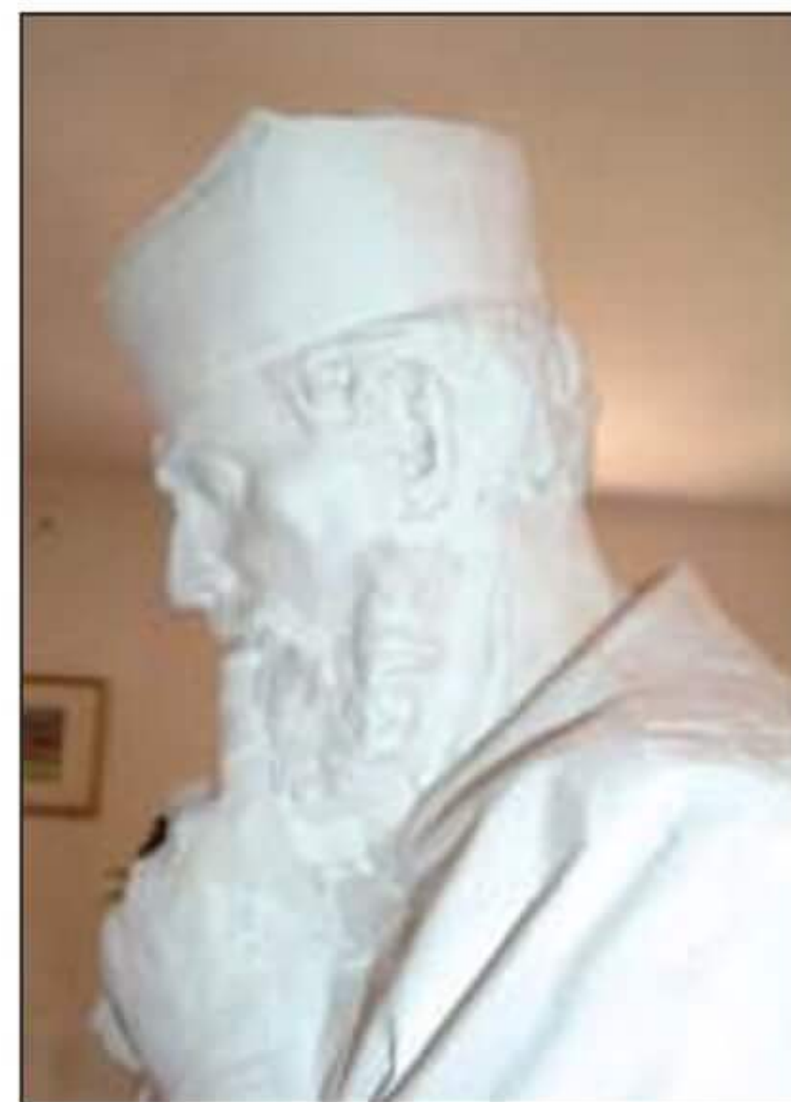
Nepomuki Szent János