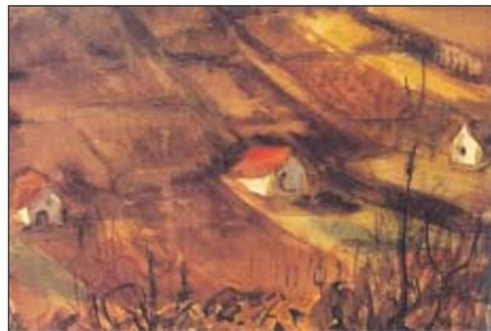
Vendekhegy márciusban /1944/

„Már több mint 400 akvarellem van. Nem tudok megenni festés nélkül. Mindig a pillanat dönti el, hogy mit festek. Szeretem a vizet, az eget, a tájt, az embereket, a városok egy-egy részletét. Szeretem rajtuk keresztül megjeleníteni az életet. Engem a látvány érdekel, a valóság ezerarcúsága. Az ihlet az igazi tehetség egyik ismérve. Aki tehetséges, nem szabadulhat tőle. Olyan ez, mint az alkoholizmus, nem enged, fogva tart, megszállottá tesz. Ha nem dolgozik az igazi művész, akkor megfullad. Ha nem „teremthet” azonnal, akkor is baj van. Az Isten-adta tehetséghez azonban hatalmas alázatra, akaratra és szorgalomra is szükség van, mert máskülönben elvész a művész.”