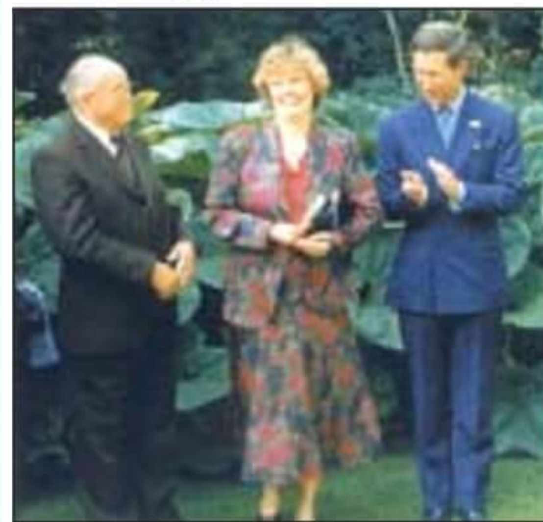
Károly walesi herceg vendége volt a művész és felesége

1993 - A brit trónörökös, Károly, walesi herceg meghívta a művészt és feleségét highgrove-i otthonába.