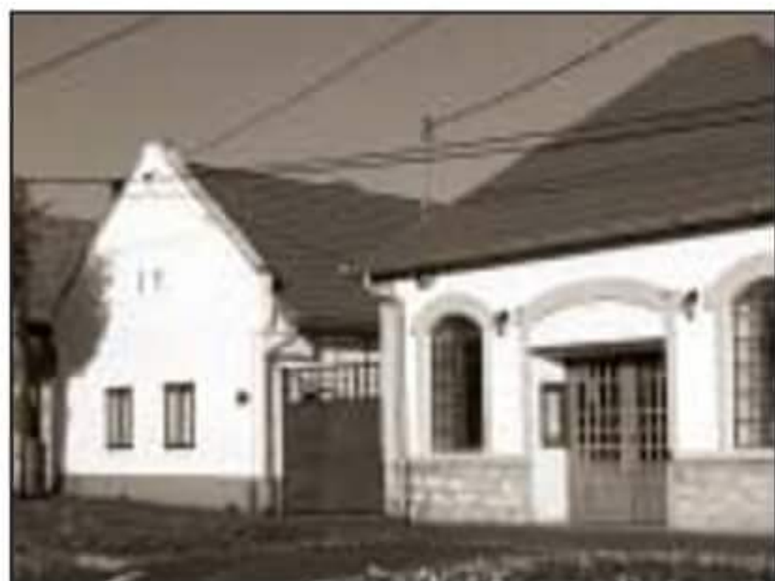
A szülői ház és a kovácsműhely ma

„Egyszerű, gerendás mennyezetű, kicsi szoba. A falakon temérdek festmény és rajz. A szoba különböző pontjain kis- és nagyméretű szobrok, agyagból mintázott figurák. A betűző napfény ragyogóvá törik meg „Árpád Vezér” erőteljes alakján, majd csillogva veszi körül Mária Terézia lovasszobrát.