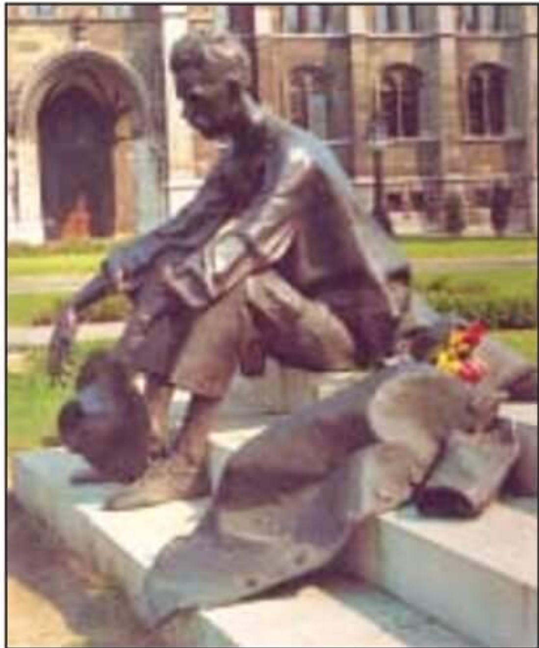
„A rakodópart alsó kövén ültem, néztem, hogy úszik el a dinnyehéj.”

1980 - A Parlament déli kapujánál elhelyezték A Dunánál című szobrát.