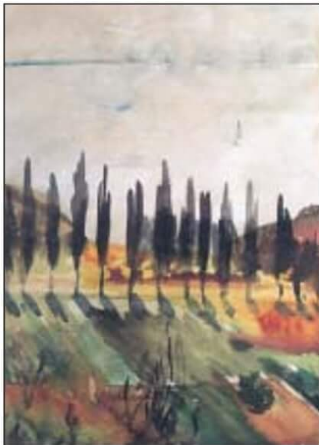
Szigligeti jegenyefák /1957/